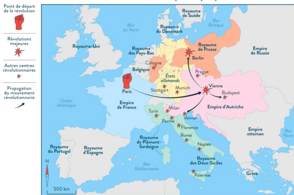
1848 : le Printemps des peuples

La France voit ainsi la IIe République proclamée, et le premier président de la République est élu démocratiquement : Louis-Napoléon Bonaparte. De même, de nouvelles constitutions sont ratifiées, dont la plupart placent en premier article la reconnaissance des peuples, de la Nation et de la souveraineté. Ces constitutions réaffirment le droit aux peuples de décider par eux-mêmes, pour eux-mêmes.