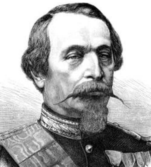
Louis-Napoléon Bonaparte (1808-1873)

Le Printemps des peuples de 1848 connaît néanmoins de nombreuses réussites, dont les plus notables ne se constatent qu'à long terme. D'abord, les idées républicaines et libérales vont durablement s'ancrer dans les mentalités. Si bien que les monarchies vont progressivement s'effondrer en Europe.